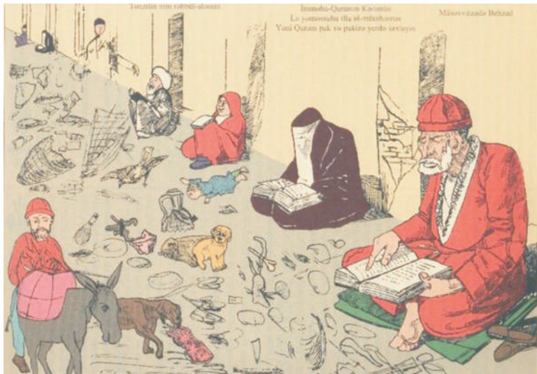
The cartoon describes a child, dogs and other creatures treated as dirt unlike the Koran in people's hands.

Mullahs in Persia issued a fatwa calling for Mirza Jalil's death. He was attacked in the Georgian capital, Tbilisi, where the magazine was published, and constantly threatened. The city was then the cultural capital of Russia's South Caucasus.