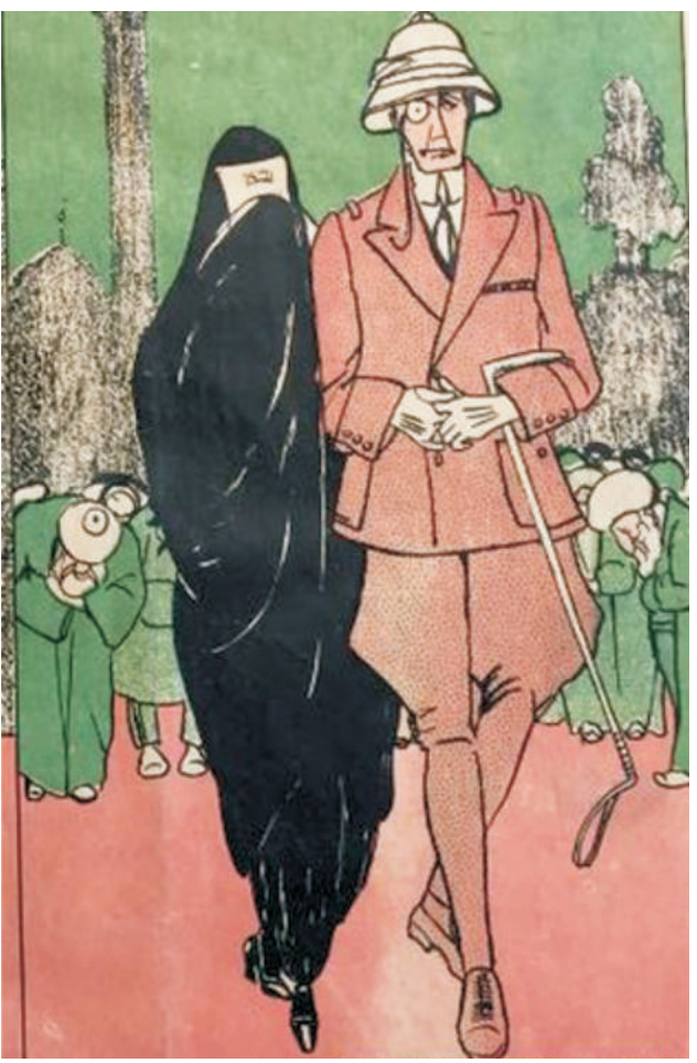
This 1929 shows the "English Consul and his wife: in England (L) and in Iran (R)