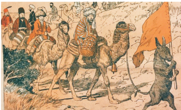
This 1909 cartoon, Pilgrimage to Hajj, had a pretty clear message

"Had I published the magazine not in Tbilisi but in Baku or Yerevan [capital of modern-day Armenia where Azerbaijanis made up the majority of the population at the time], they would have destroyed my office and killed me," Jalil explained.