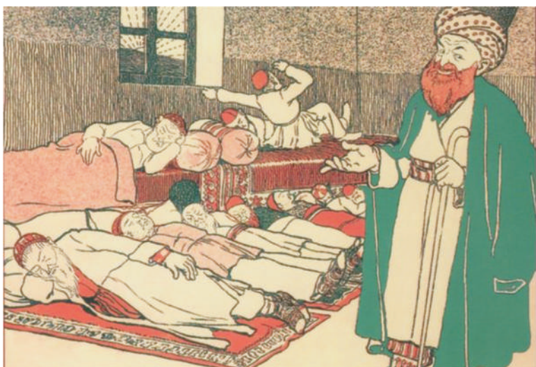
First issue of Molla Nasreddin magazine. 1906

For more than 20 years, the magazine bearing his name would present the world to its readers through the medium of cartoons and text.