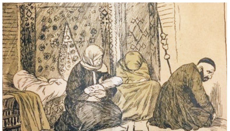
In the top cartoon a boy is born, while below the father responds to the birth of a girl (1909)