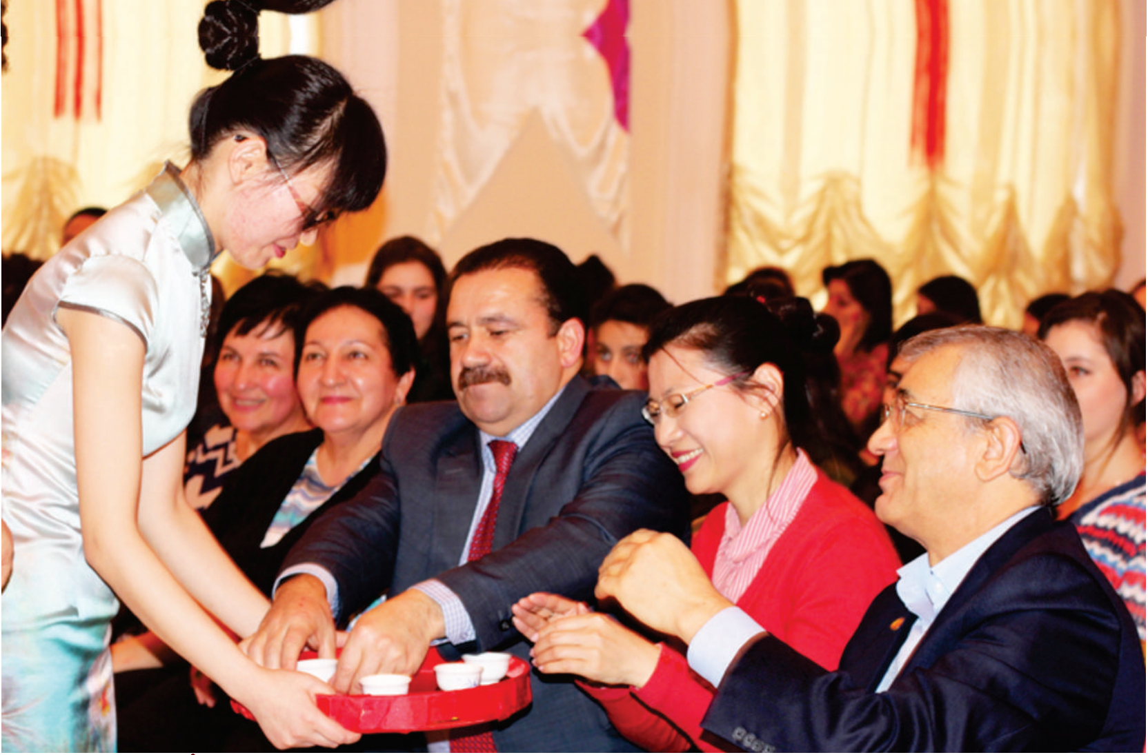
ÇİN YAZ BAYRAMI