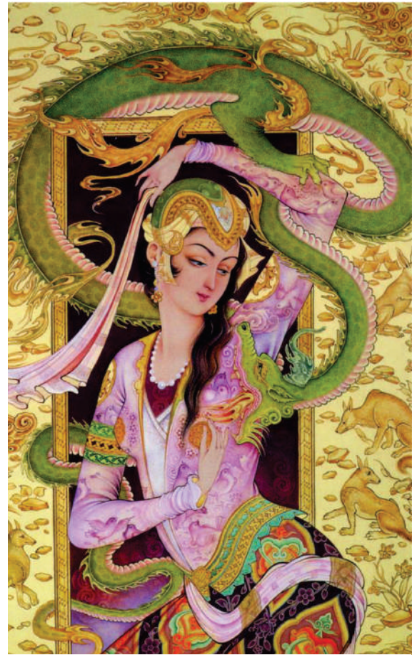
XƏZƏR XƏBƏR JURNAB7