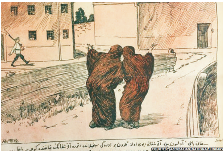
In this cartoon, the magazine depicts a prison with windows and a house of Muslim women with none

28 February 2015 By Konul Khalilova BBC News Europe