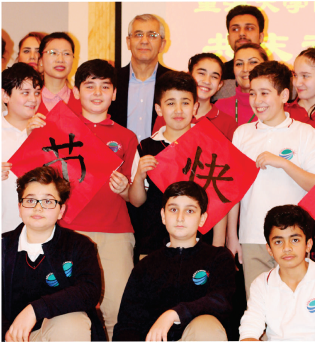
CHINESE SPRING FESTIVAL