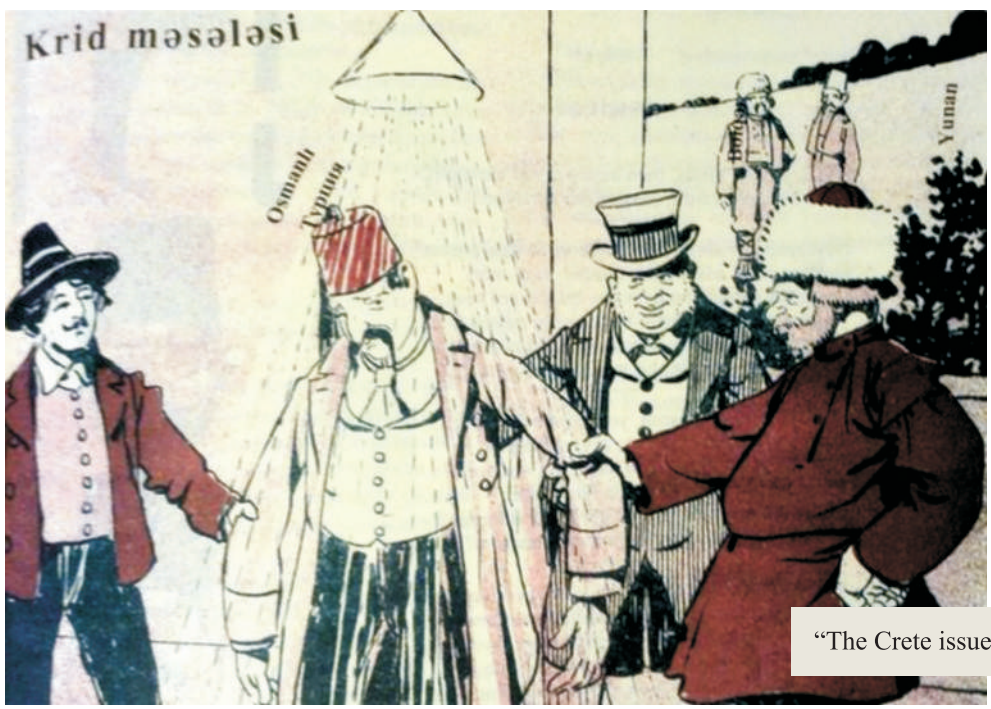
“The Crete issue. No need to get too hot.”