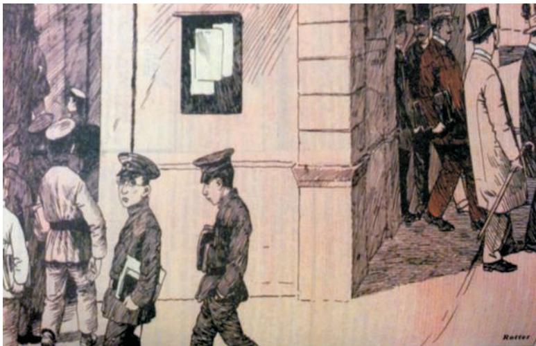
Students enter a European school and leave as educated adults

The magazine campaigned for women's rights and played an important part in women in Azerbaijan being granted the right to vote in 1919, at around the same time as women in the UK and US.